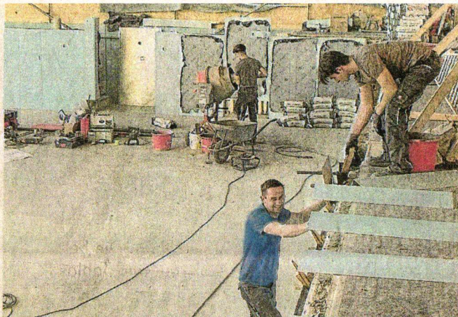
Noch gibt es für die Handwerker einiges zu tun, bis das große Becken und alle Anschlüsse fertig sind.

Noch wird an diesem Februartag ordentlich gearbeitet: Vier Wochen hat es allein gedauert, bis alle Fliesen von den Wänden geklopft waren, „da konnte man vor lauter Staub nichts mehr sehen“, erinnert sich Lucka. Tonnen haben die Arbeiter abtransportiert. Ersetzt werden die Fliesen durch Edelstahl. Auffällig: Wer jetzt eine glänzende graue Wanne wie beispielsweise im Südbad erwartet hat, sieht sich getäuscht, die Wände leuchten in einem freundlichen Hellblau: „Eingefärbter Edelstahl“, erklärt Lucka. Jetzt muss noch der Estrich in die letzten Lücken. Die Eckenteile kommen diese Woche und müssen dann